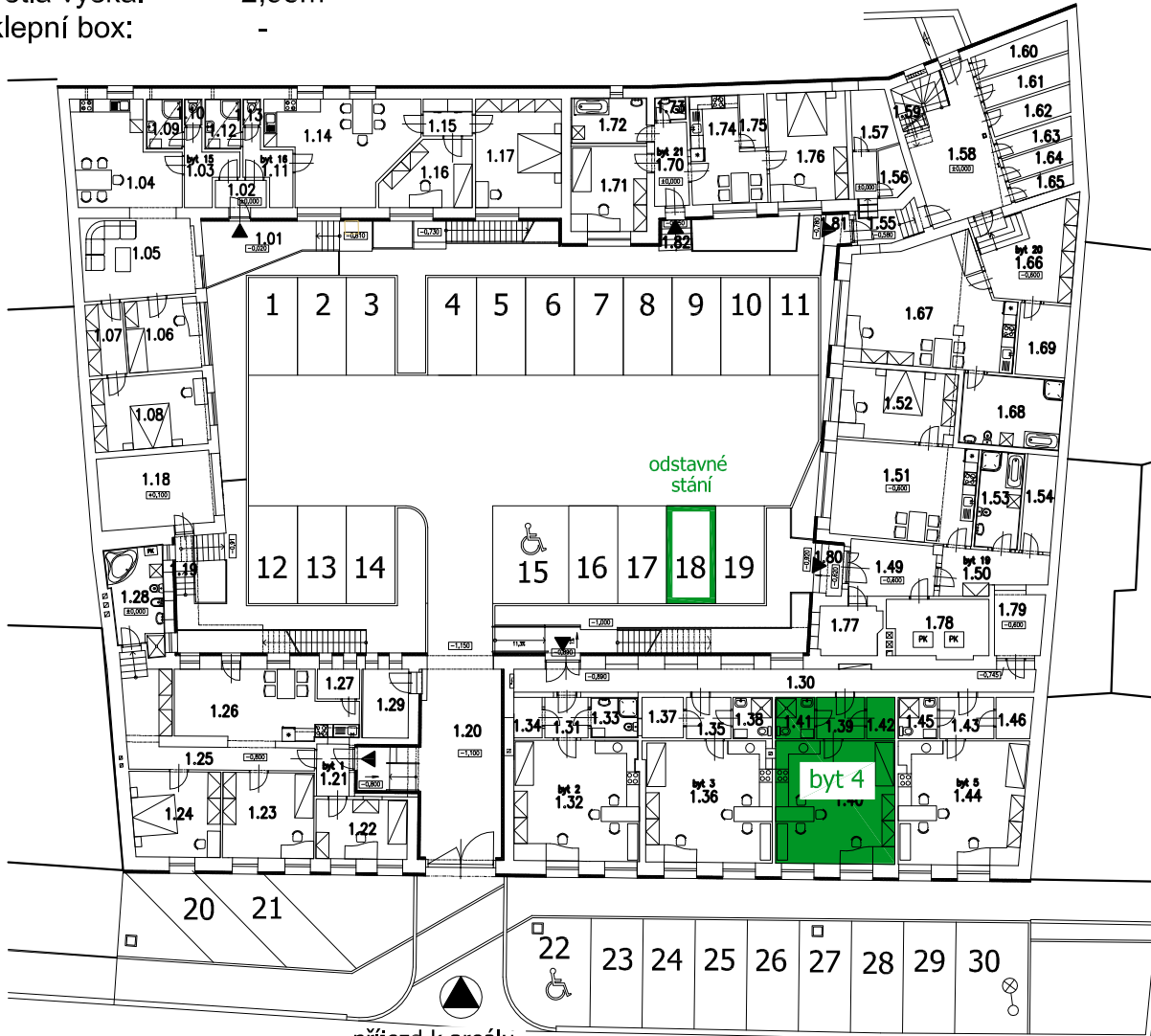
příjezd k areálu z ulice Dukelská

Podlaží: 1.NP Bytová plocha: 41,1 m 2 Světlá výška: 2,95m Sklepní box: -