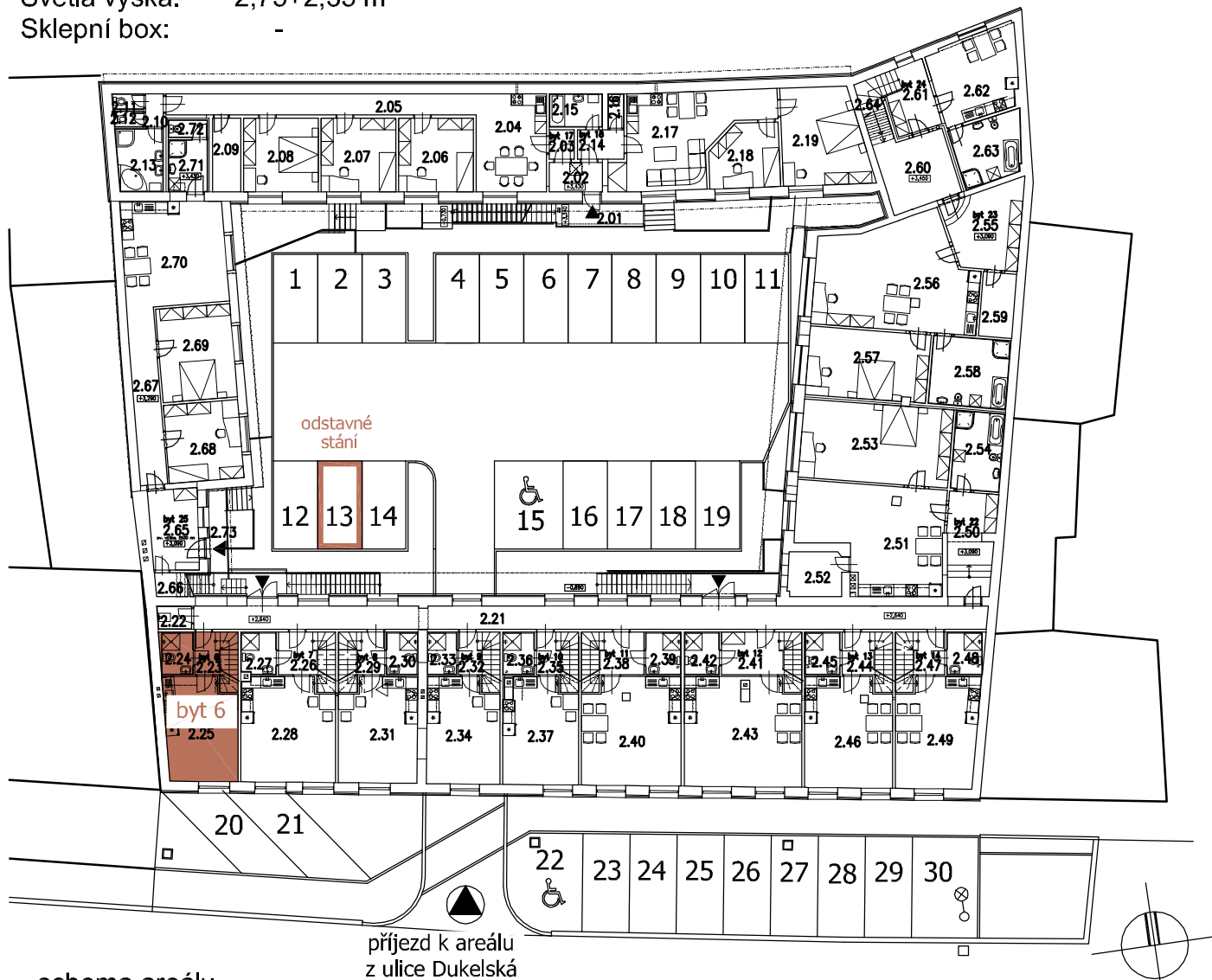
schema areálu 2.NP+zpevněné plochy

Podlaží: 2.NP+3.NP Bytová plocha: 50,7 m 2 Světla výška: 2,75+2,35 m Sklepní box: -