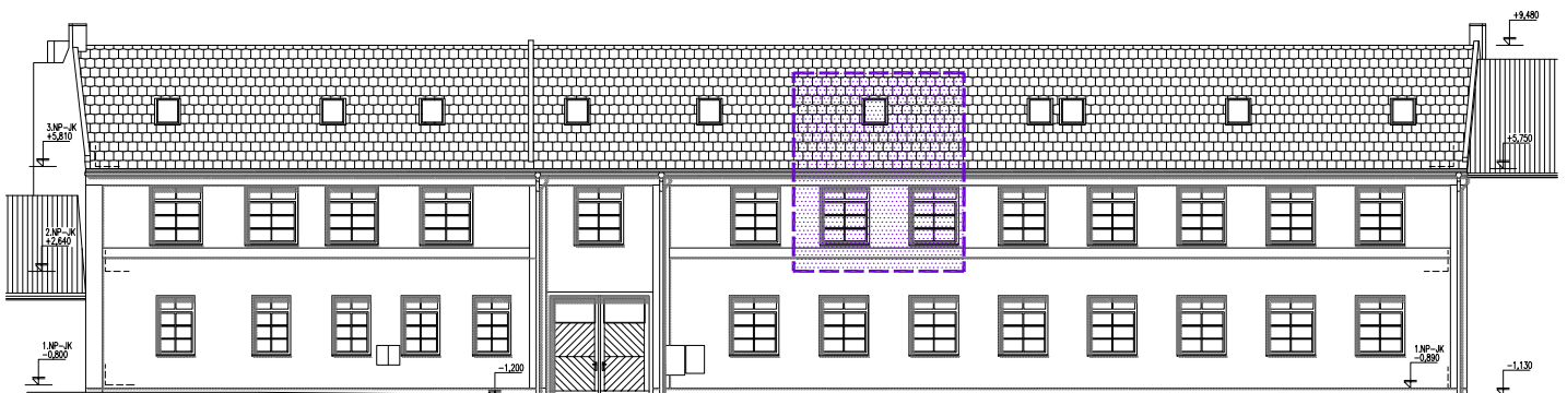
pohled jižní (z ulice Dukelská) s vyznačením plochy bytu, M 1:250