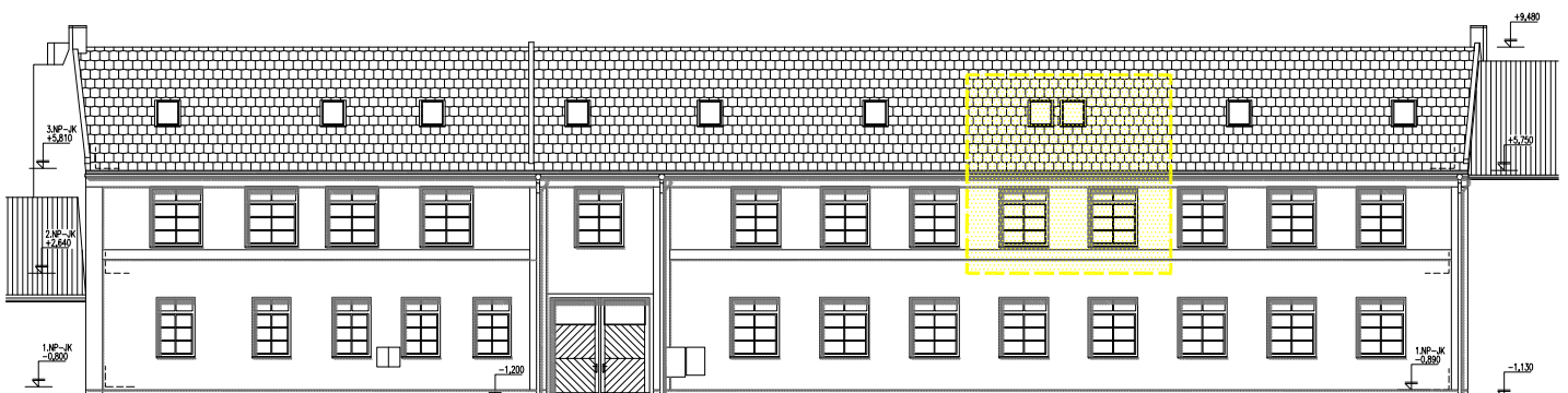
pohled jižní (z ulice Dukelská) s vyznačením plochy bytu, M 1:250