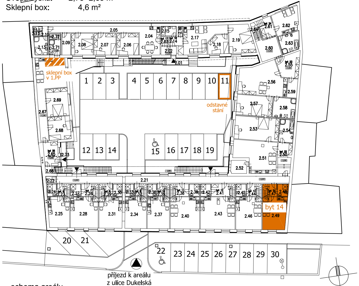
schema areálu 2.NP+zpevněné plochy