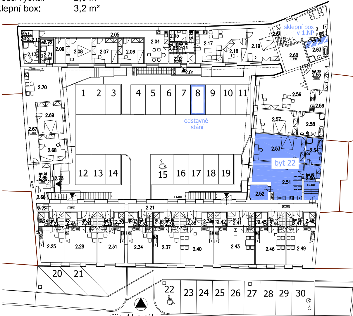
příjezd k areálu z ulice Dukelská