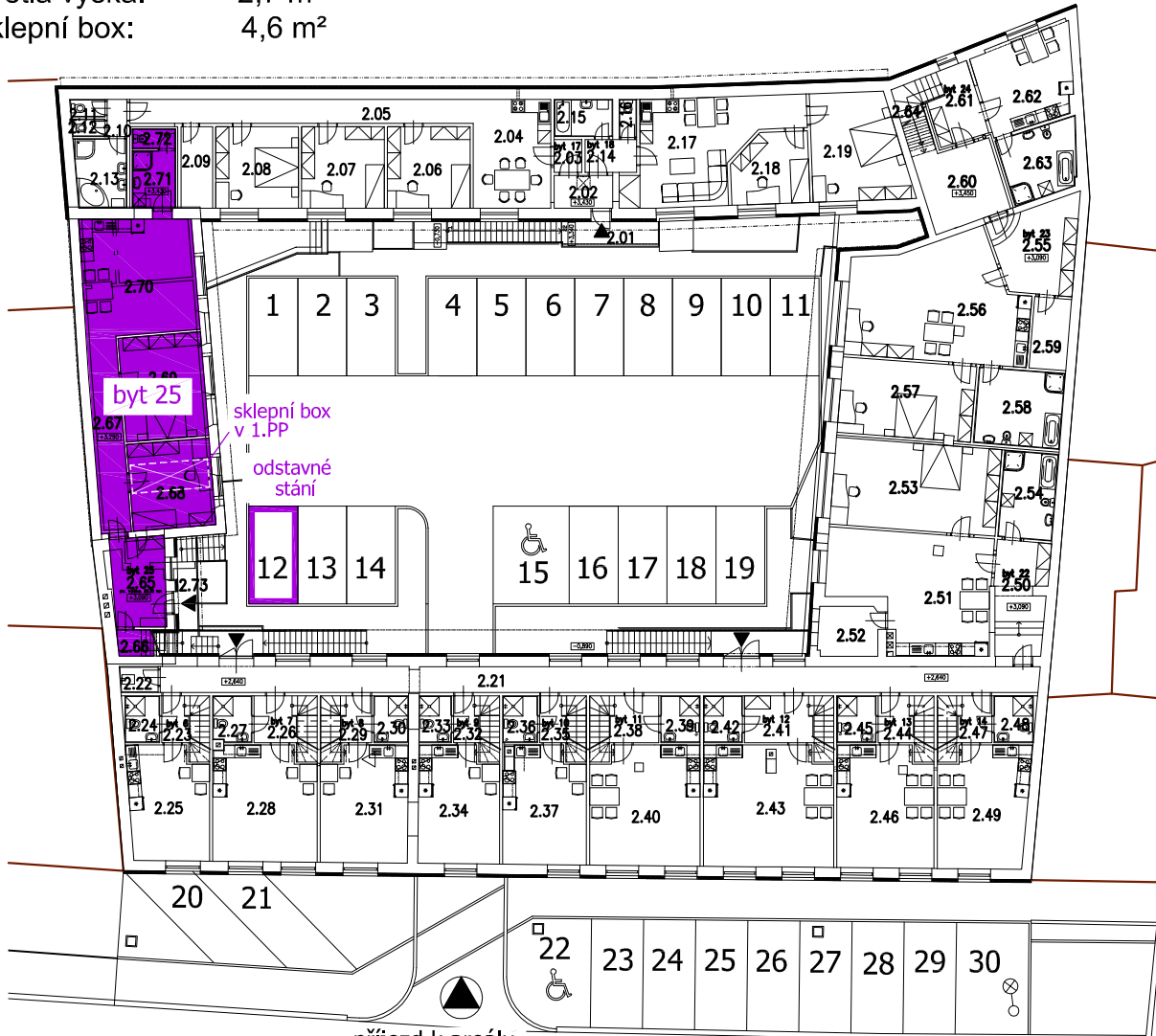
příjezd k areálu z ulice Dukelská